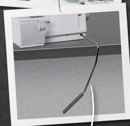
Sistema manos libres BERNINA (FHS) con palanca para la rodilla