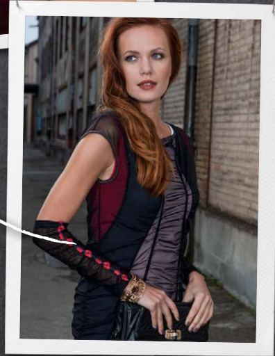
Punto de cadeneta