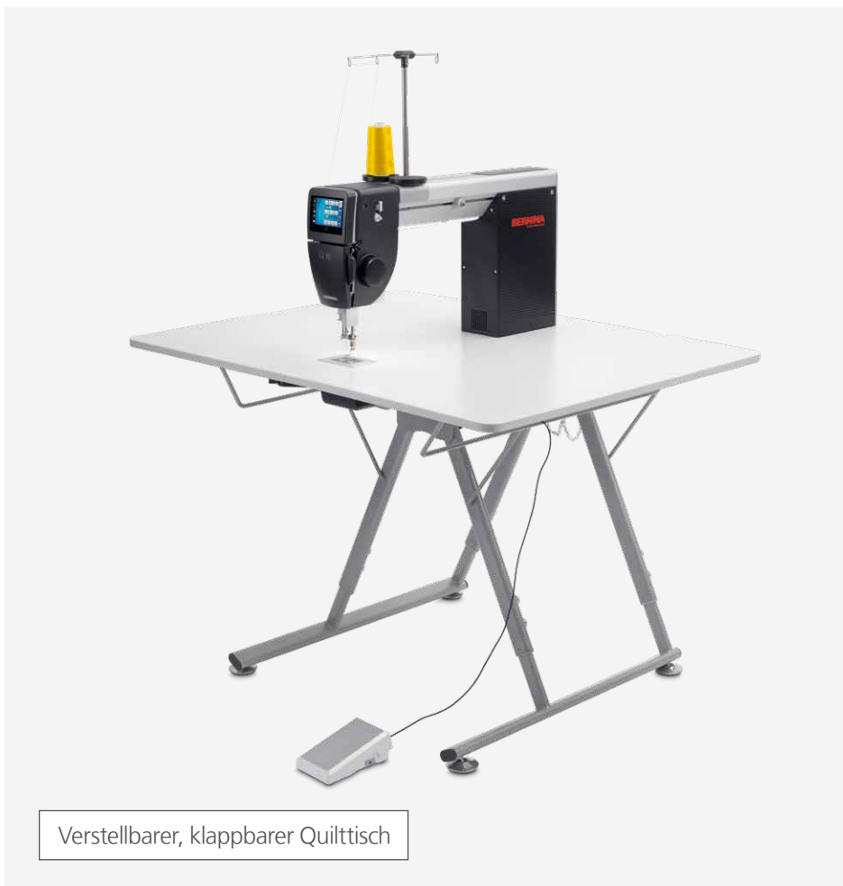
Verstellbarer, klappbarer Quilttisch